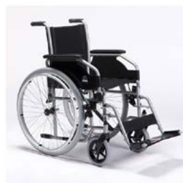
Fauteuil roulant manuel 708 delight