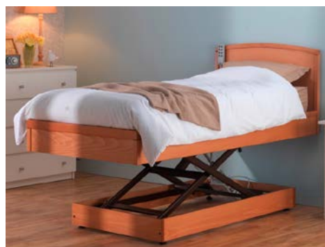
Lit releveur à hauteur variable Eurodesign