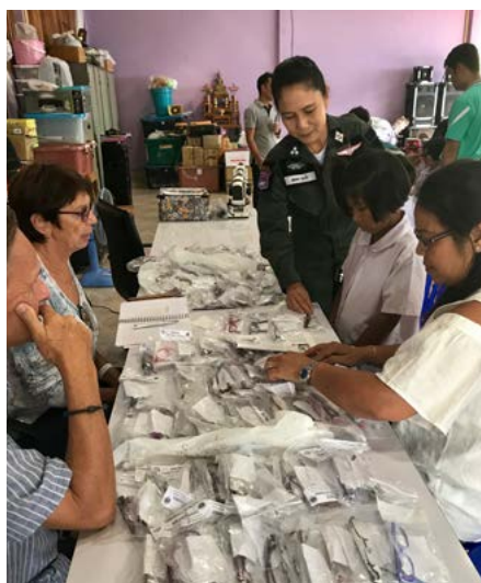
Distribution des paires de lunettes Médico en Thaïlande