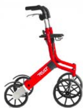
Déambulateur à roulettes let's go out

Tél. 09 81 06 75 37 Prix d'un appel local