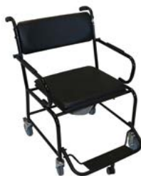
Chaise garde robe gr50